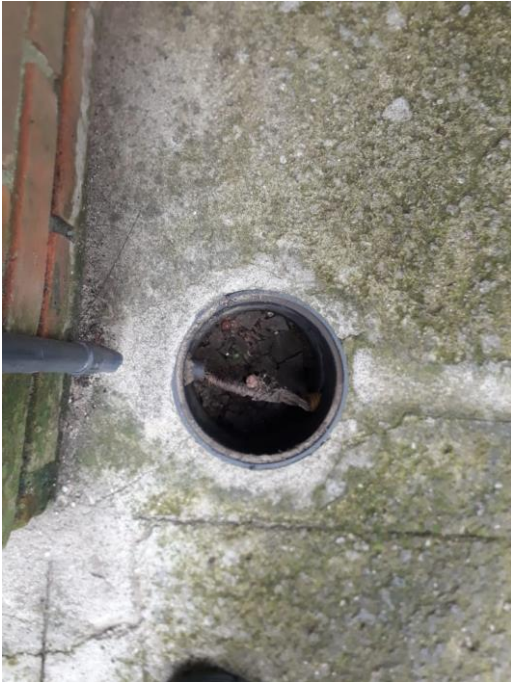
Figura 8. Caixa de inspeção mau estado de conservação. (Caixa suja).

As edificações possuem sistema de para-raios instalados;