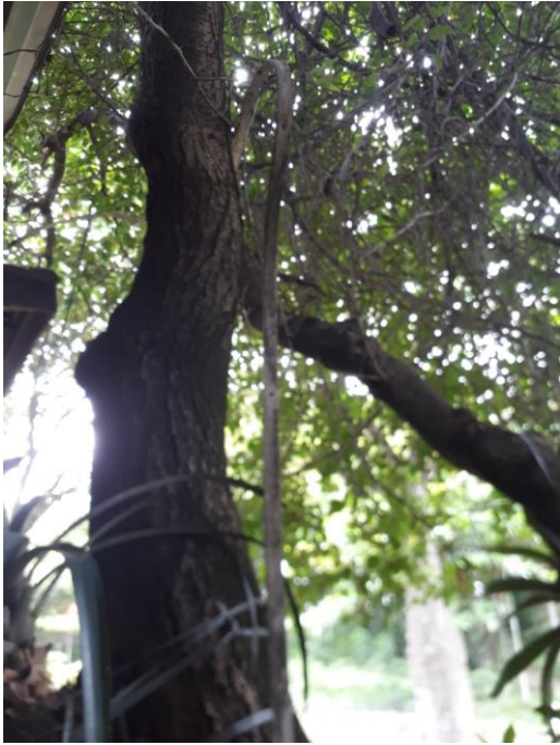
Figura 10: Fita de Para-raios solta.