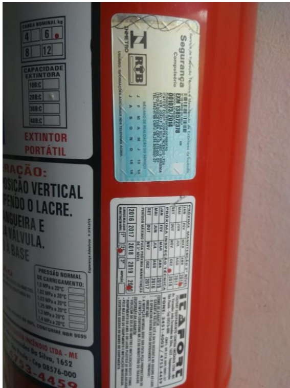
Figura 5: Extintores vencido.