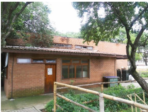
Figura 13: Instalações do para-raios Falta de cabo de aço e captor Franklin.