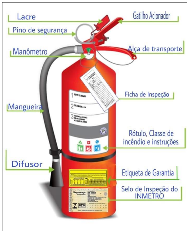
Figura 7: Localização dos itens à serem inspecionados.