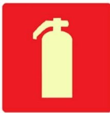
Figura 17: Exemplo de placa de sinalização de extintores