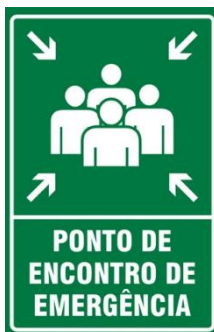
Figura 18: Exemplo de placa de sinalização de Ponto de Encontro