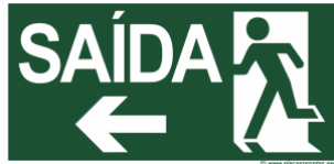
Figura 16: Exemplo de sinalização de saída