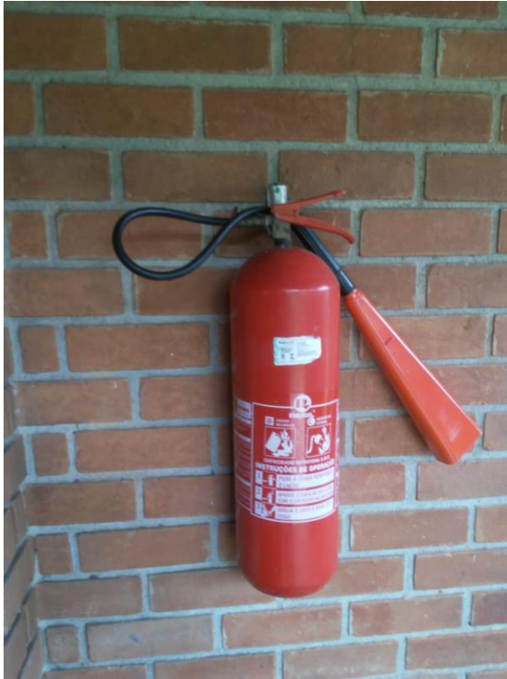
Figura 3: Extintores de incêndio sem placa de sinalização.