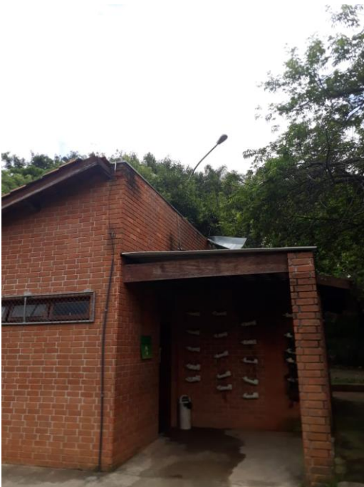
Figura 9: Edificação sem a haste de para raio e sem captor.