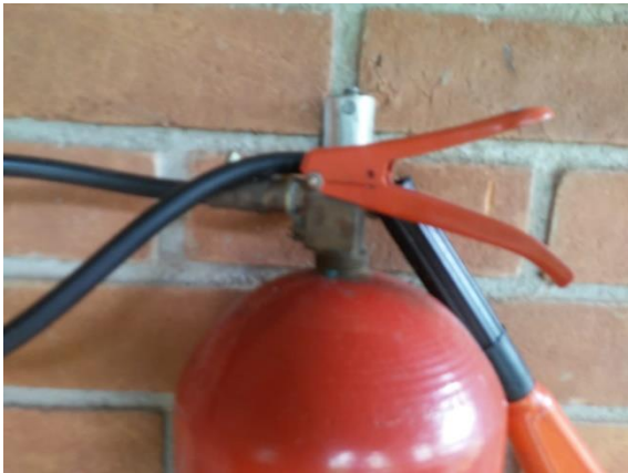
Figura 4: Extintores de incêndio sem lacre.