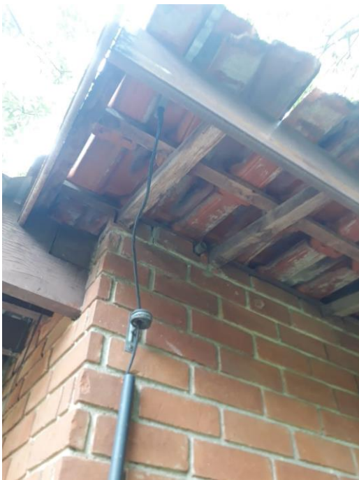
Figura 11: Instalações do para-raios cabo mau fixado.