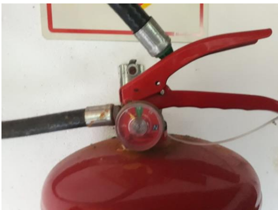
Figura 2: Extintores de incêndio vazio ou despressurizado (sem pressão).