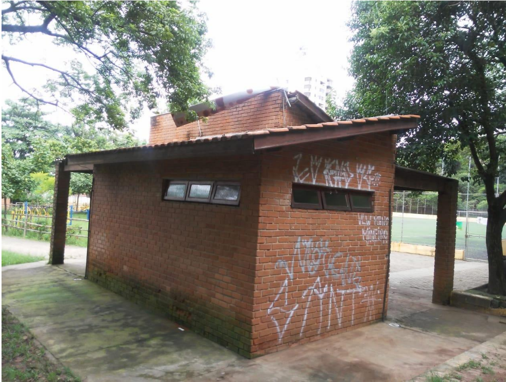
Figura 14: Edificação 2.