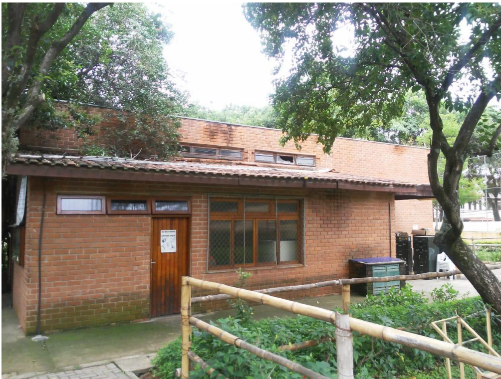
Figura 13: Edificação 1;