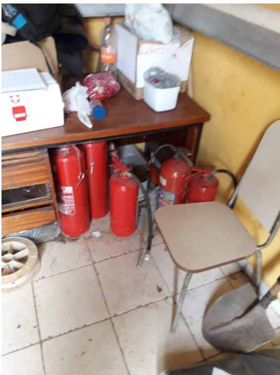
Figura 1: Extintores de incêndio em mal Condicionado.