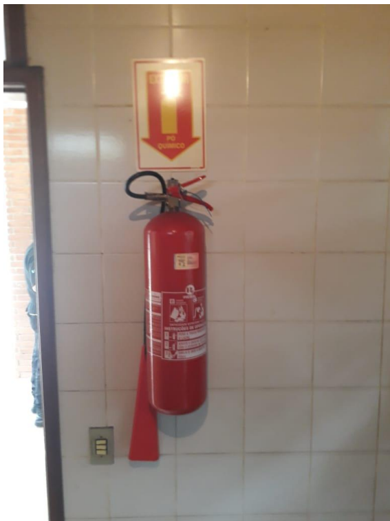
Figura 6: Extintores de incêndio com sinalização inadequada.