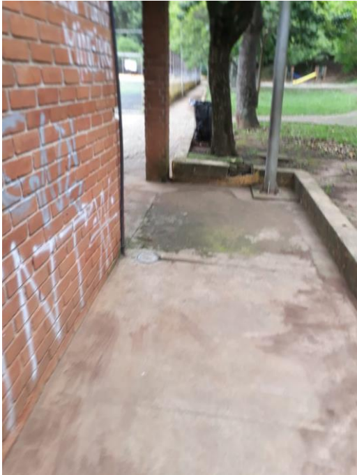
Figura 12: Instalações do para-raios Falta de presilha de fixação.